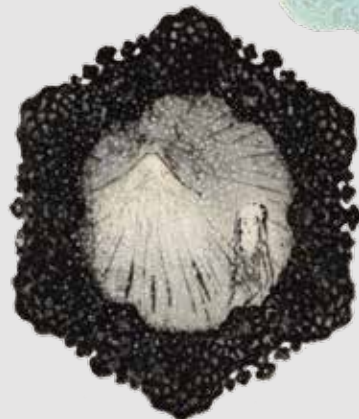
《アノ山へ登れ!》 ドライポイント、エッチング 雁皮刷 / 14.0x11.5cm 2021年