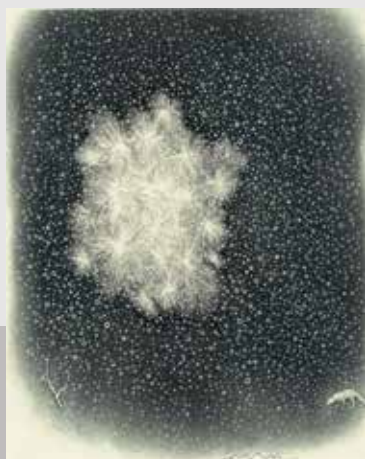
《光のある場所》 エッチング、アクアチント エングレーヴィング、雁皮刷 / 21.5x18.5cm 2017年