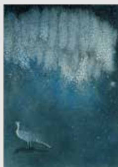
《お気に入りではない場所》 エッチング、アクアチント 雁皮刷 15.0x10.5cm 2012年

結城は日常の記憶の風景、或いはその記憶を画面に配置し夢の世界を構築します。白い光の粒子が広がる詩情溢れる銅版画の世界をぜひご覧下さい。