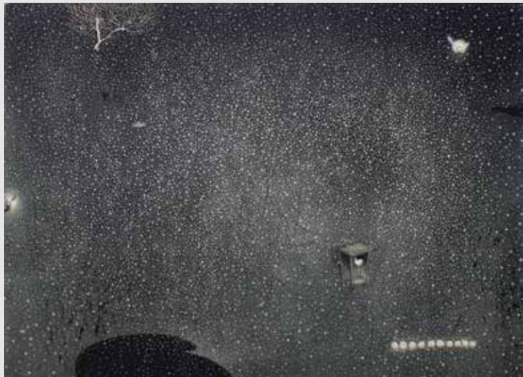
《In my Garden 1》 エッチング、アクアチント ドライポイント、雁皮刷 / 26.5x36.5cm 2010年