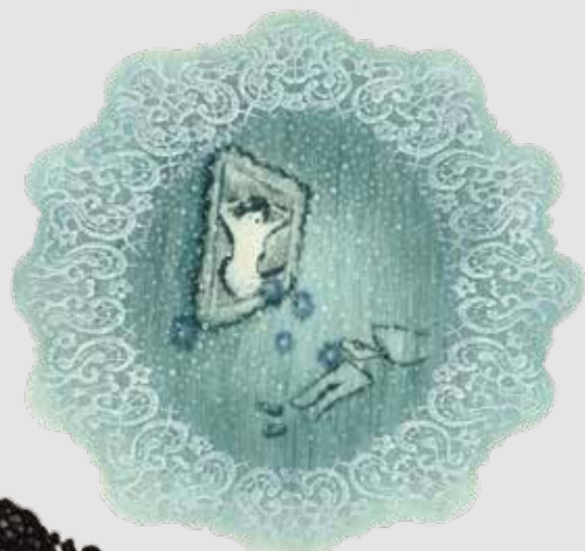
《メトロポリタンミュージアム》 ドライポイント、エッチング、エングレーヴィング 雁皮刷 / 15.5x16.5cm 2020年

結城泰介は1978年東京都に生まれ2003年武蔵野美術大学大学院造形研究科美術専攻版画コース修了、その後ハーグ王立美術アカデミー（オランダ）に留学しました。帰国後2007年第75回記念版画展（日本版画協会）にて19.5x22.5cmという小さなサイズで山口源新人賞を受賞し脚光を浴びます。現在では地元小平市に様々な人が銅版画やリトグラフを制作出来る版画工房 TYPS を設立。以後代表を務めつつ2021年より父の故郷山形市の美大、東北芸術工科大学で教鞭を執っています。