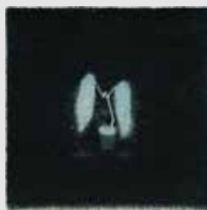
《夢の中の会話》 エッチング、エングレーヴィング 雁皮刷 / 12.0x11.0cm 2013年