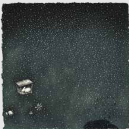
《まどろみの庭》 エッチング、アクアチント、ドライポイント エングレーヴィング、雁皮刷 / 21.0x21.0cm 2013年