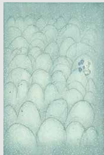
《世界を股に掛ける鹿》 エングレーヴィング、ドライポイント、エッチング 雁皮刷 21.5x14.0cm 2019年